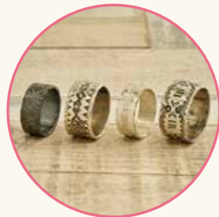
オリジナルジュエリー制作